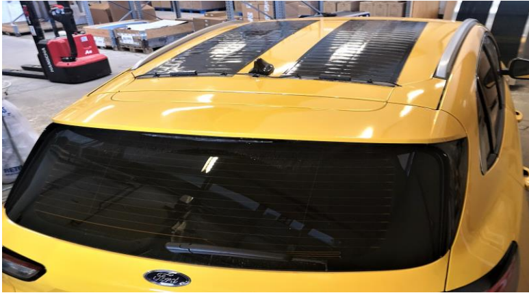
Illustration kun som eksempel: Illustration only as an example: Abbildung nur als Beispiel:

DK: Normalt klippes stikkene af solcellerne og sættes i stedet sammen med de medfølgende presmuffer og krympeflex.