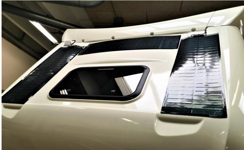
Illustration kun som eksempel: Illustration only as an example: Abbildung nur als Beispiel:

DK: Normalt klippes stikkene af solcellerne og sættes i stedet sammen med de medfølgende presmuffer og krympeflex.