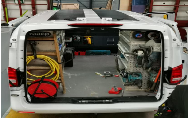
Illustration kun som eksempel: Illustration only as an example: Abbildung nur als Beispiel:

DK: Normalt klippes stikkene af solcellerne og sættes i stedet sammen med de medfølgende presmuffer og krympflex.