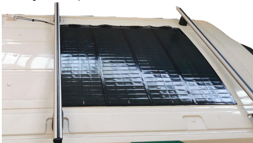
Illustration kun som eksempel: Illustration only as an example: Abbildung nur als Beispiel: