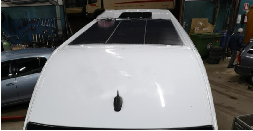
Illustration kun som eksempel: Illustration only as an example: Abbildung nur als Beispiel:

DK: Normalt klippes stikkene af solcellerne og sættes i stedet sammen med de medfølgende presmuffer og krympflex.