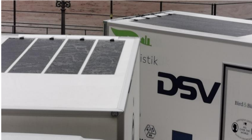
Illustration kun som eksempel: Illustration only as an example: Abbildung nur als Beispiel:

DK: Normalt klippes stikkene af solcellerne og sættes i stedet sammen med de medfølgende presmuffer og krympeflex.